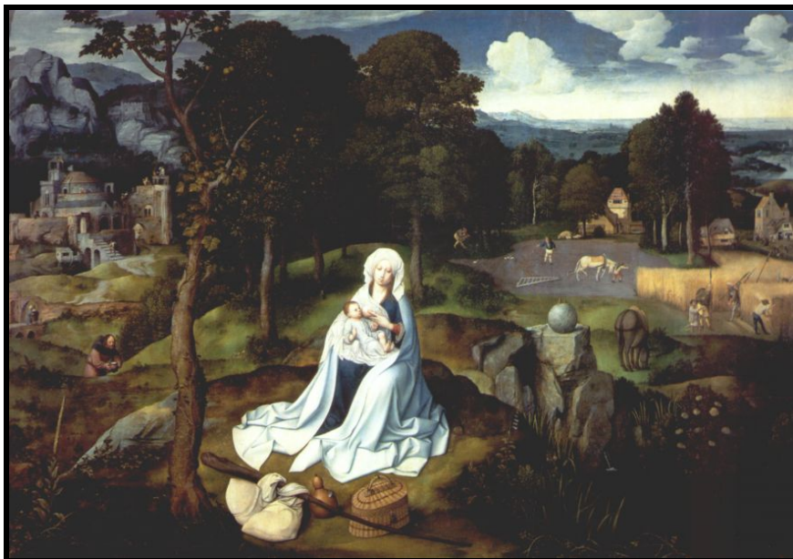
« La fuite en Egypte » de Joachim Patinir, Musée du Prado, Madrid

Comme son nom l'indique l'oratorio est une invention de membres de l'ordre religieux italien des Oratoriens, au XVI e siècle. À cette époque il était interdit aux compositeurs d'opéra de tirer l'argument de leur œuvre d'un sujet sacré. Le but des créateurs de l'oratorio était de contourner cette interdiction en créant une forme spécifique qui puisse aborder ce type de sujets tout en présentant le même potentiel de séduction que l'opéra.